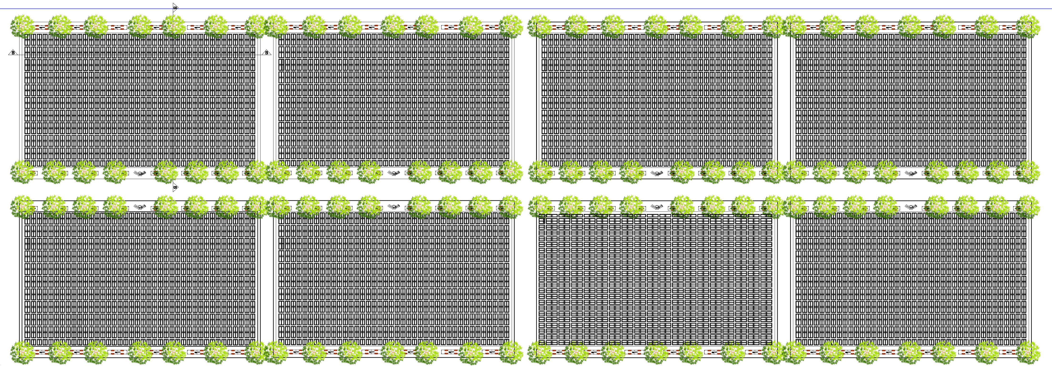
IMPLANTAÇÃO GERAL esc 1:800